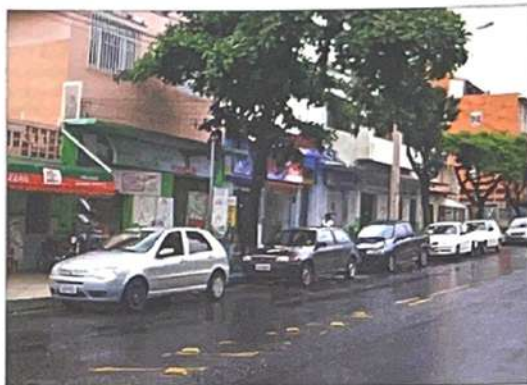
Nas principais avenidas da região, como a Isabel Bueno, vários estabelecimentos comerciais estão à disposição dos consumidores com ótimos produtos e serviços