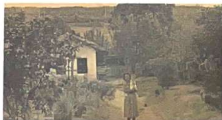
Casa na atual rua Boaventura. No fundo ficava o córrego onde é possível avistar também o terreno da UFMG e parte de onde hoje é a avenida Antônio Carlos