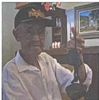
Com sua ótima memória, lucidez e casos dos mais interessantes, Seu Dodô faz com que as conversas sejam agradáveis e divertidas

A avenida Antônio Carlos também era um grande capoeirão, o Mineirão um imen-