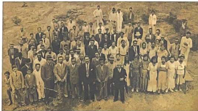
Moradores das fazendas reunidos após um dia de eleição. No fundo se avista parte do curral e caminhos onde hoje é a rua Intendente Câmara