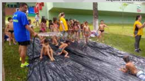
ARQUIVO CLUBE JARAGUÁ

Ações, investimentos e inaugurações na região. Página 3 e 5