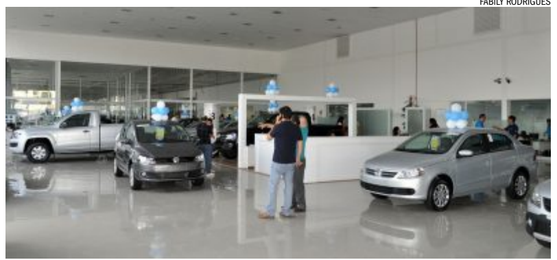
Concessionária Mila investiu em uma loja de grande porte no bairro Liberdade para oferecer mais serviços, opções e conforto aos seus clientes