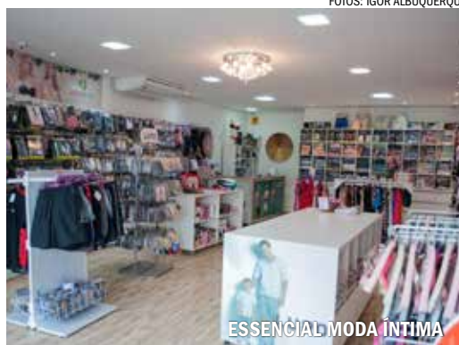
ESSENCIAL MODA ÍNTIMA

Em conversa com o Jornal Jaraguá em Foco, os comerciantes citaram algumas ações que ajudam a driblar a crise. Algumas delas são a busca por novos fornecedores, a criação de promoções e o aumento da diversificação