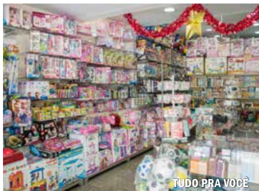
TUDO PRA VOCÊ